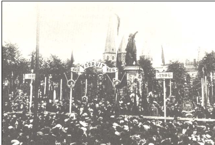
De jubelstoet met massabijeenkomst op de Vrijdagmarkt onder het oog van Artevelde op een driedaagse manifestatie vanaf zaterdagavond 21 juli (lichtstoet vanaf 22.00 u), 22 juli (jubelstoet) en herhaling op 29 juli 1906 n.a.v. 25 jaar Vooruit. Ook De Clercq bevond zich in deze massa en was behoorlijk geïmponeerd door het socialistische machtsvertoon.