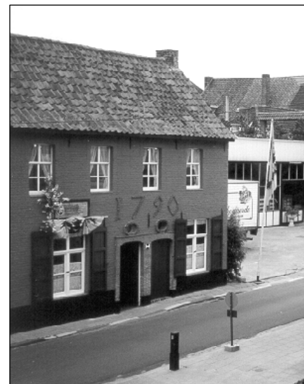
Geboortehuis van René De Clercq, nu zijn museum